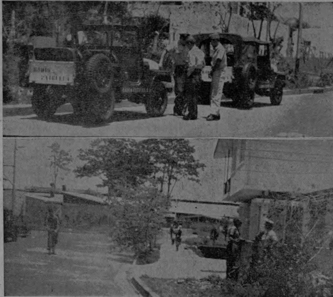
Arriba y abajo aspectos de la Embajada de Cuba esta mañana al redoblar la Fuerza Pública su vigilancia en el sector, debido a informes que hablaban de un supuesto ataque a la sede de esa representación en Barrio

Estuvieron presentes en la reunión, los representantes de Costa Rica, República Dominicana, Ecuador, Guatemala, Haití, Honduras y Nicaragua.