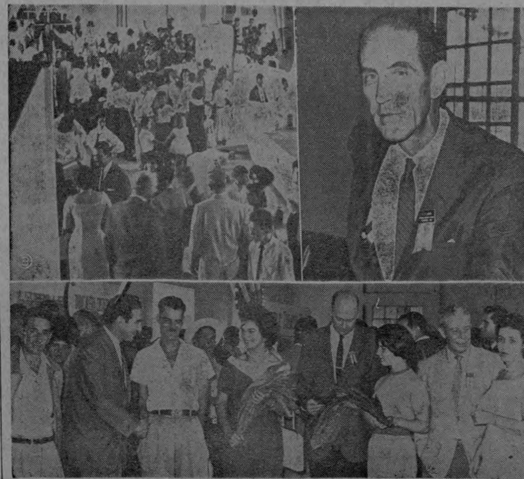
EN LA FERIA DEL TABACO. — Varios aspectos de la Primera Feria del Tabaco inaugurada ayer en Palmares. Las gráficas de Carrillo nos presentan arriba a la Reina, candidata de Palmares, miembros de empresas tabacaleras y del Comité felicitando a los ga-