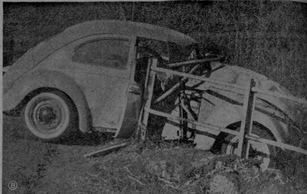
SIGUEN ACCIDENTES EN LA "CURVA TRAGICA". — En horas del amanecer de hoy, en La Cuesta de Las Bermudas, yendo para Heredia, se ratificó nuevamente que aquella curva sigue siendo la más trágica en lo que a número de accidentes se refiere. Nuestro fotógrafo Solano, captó esta fotografía, de por

—La organización se llevó a cabo por un Comité Permanente integrado por 15 sacerdotes, asistiendo, por supuesto, el señor Arzobispo. Por datos recibidos desde distintos lugares del país podemos asegurar anticipadamente que el éxito será rotundo.